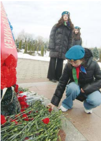
22 февраля, в преддверии Дня защитника Отечества, юные миротворцы почтили память бойцов, погибших за Родину,

воздав дань уважения всем славным защитникам нашего Отечества. Уроженцы Северной Осетии внесли весомый вклад в Победу над фашизмом в Великой Отечественной войне. В рядах Красной армии, в партизанских отрядах сражались порядка 95 тысяч наших земляков. Каждый второй не вернулся с поля боя. Защитники Отечества не раз проявляли доблесть и героизм в послевоенные годы.